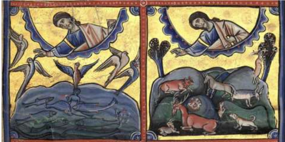
Enluminures de la Bible de Souvigny (XIIe s., source : Wikipédia )